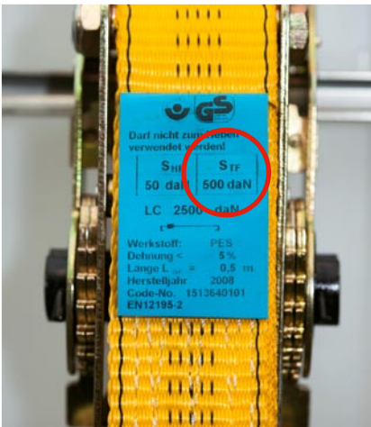
Etikett: Den STF-Wert (Vorspannfähigkeit) vor allem beim Niederzurren beachten. Fehlt dieser, das Zurrmittel nicht zum Niederzurren einsetzen.