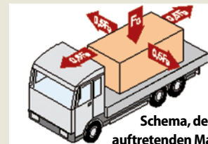
Schema, der maximal auftretenden Massekräfte